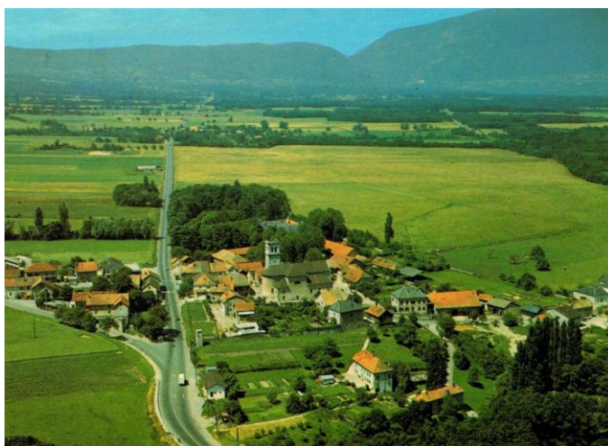
Vue aérienne du centre du Viry, avec au premier plan l'église au cœur du village, puis le château du comte de Viry caché dans les grands arbres et le terrain d'aviation.