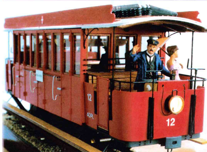
Voiture automotrice du chemin de fer du Salève telle qu'elle se présentait dans les dernières années d'exploitation (1930 à 1935). Modèle réduit à l'échelle 1/22,5 réalisé par G. Lepère et C. Gurtner en 1995.