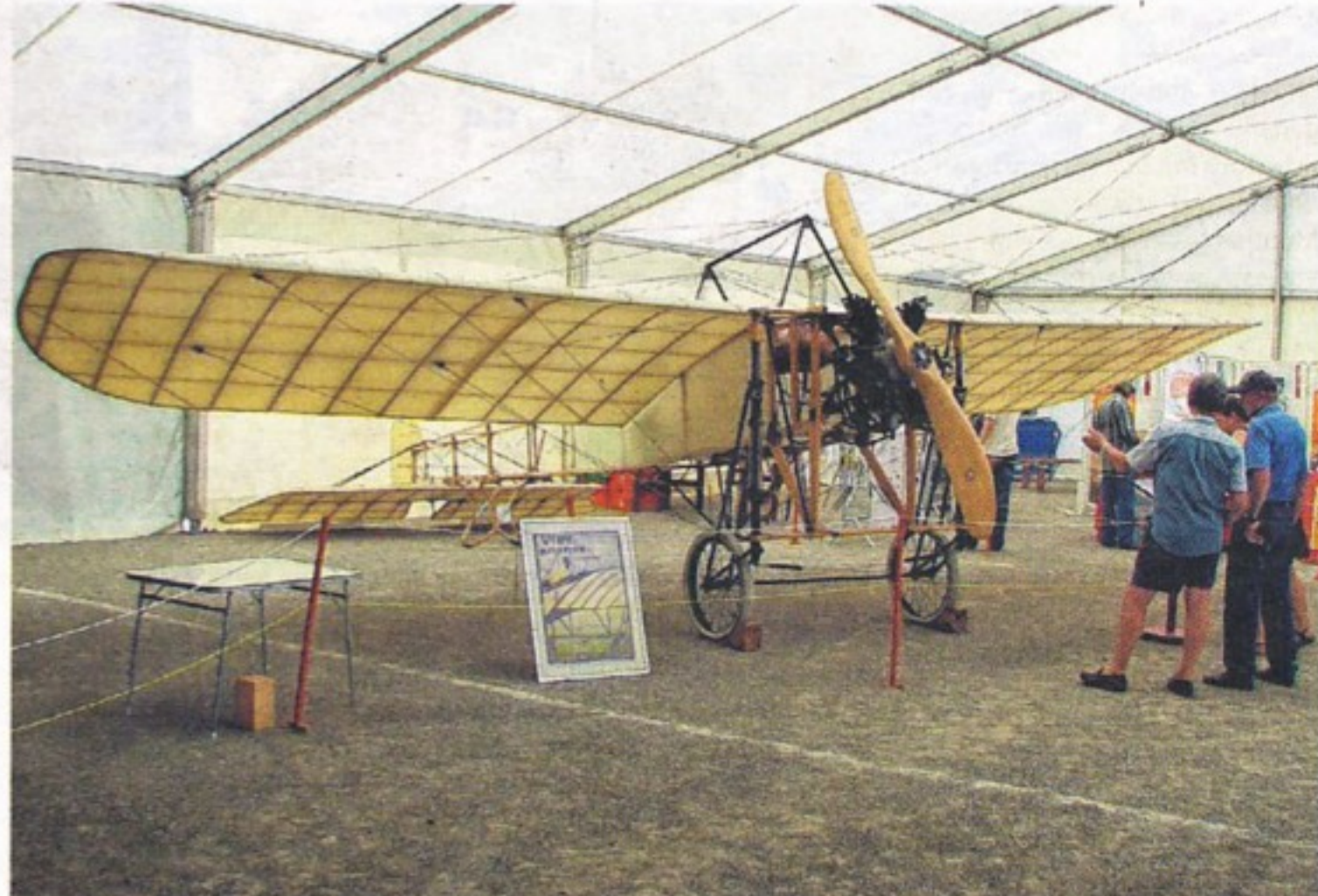
Une réplique du biplan Dufaux-4, présentée lors du 100e anniversaire du meeting de Viry, en août 2010.