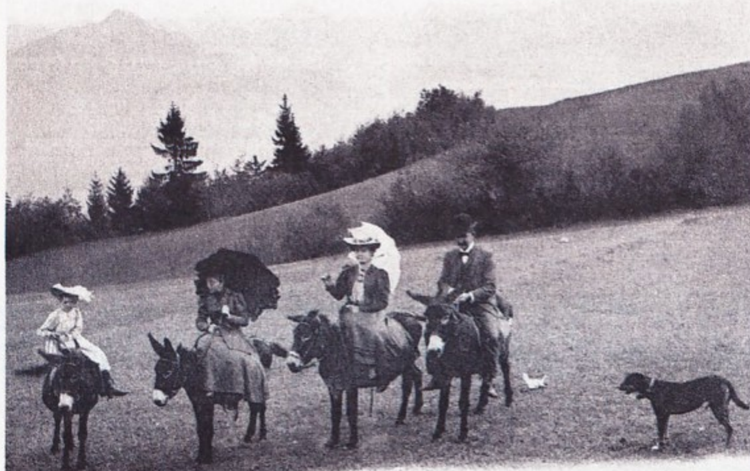
J. J. 0084 Salève — En route pour les Treize-Arbres

ÉTABLISSEMENT BIEN EXPOSÉ OUVERT TOUTE L'ANNÉE PROXIMITÉ DE LA GARE ET DE L'ÉGLISE ROMAINE POSTE TROIS FOIS PAR JOUR ÉGRAPHE - TÉLÉPHONE DANS L'HÔTEL ÉCLAIRAGE ÉLECTRIQUE