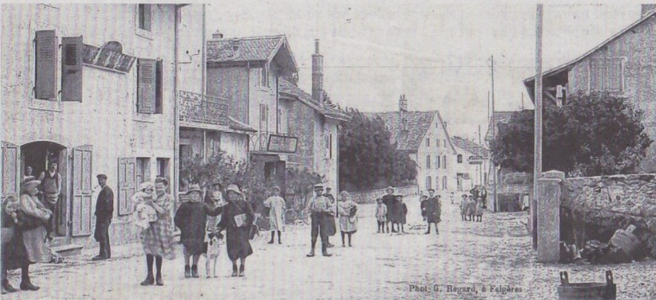
Des enfants de la commune de Valleiry, comme tous leurs camarades du canton de Saint-Julien, ont participé à cette sortie scolaire sur les flots du Léman en juillet 1913.

En ce début du XX e siècle, les instituteurs du canton de Saint-Julien, comme tous leurs collègues de France, étaient surnommés les "Hussards noirs de la République". Cette formule inventée par l'écrivain Charles Péguy évoquait la fonction prestigieuse de ces enseignants sortis de l'Ecole Normale qui avaient la lourde charge d'assurer la mission fondamentale d'une instruction scolaire obligatoire, gratuite et laïque pour tous les enfants de France. Cette école avait été mise en place par Jules Ferry après la votation de la loi de séparation des églises et de l'Etat par le parlement en 1905.