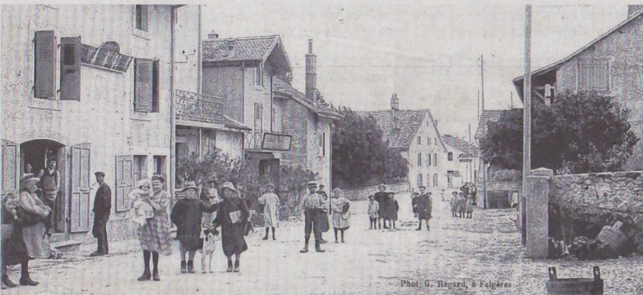
Des enfants de la commune de Valleiry, comme tous leurs camarades du canton de Saint-Julien, ont participé à cette sortie scolaire sur les flots du Léman en juillet 1913.

En ce début du XX e siècle, les instituteurs du canton de Saint-Julien, comme tous leurs collègues de France, étaient surnommés les "Hussards noirs de la République". Cette formule inventée par l'écrivain Charles Péguy évoquait la fonction prestigieuse de ces enseignants sortis de l'Ecole Normale qui avaient la lourde charge d'assurer la mission fondamentale d'une instruction scolaire obligatoire, gratuite et laïque pour tous les enfants de France. Cette école avait été mise en place par Jules Ferry après la votation de la loi de séparation des églises et de l'Etat par le parlement en 1905.