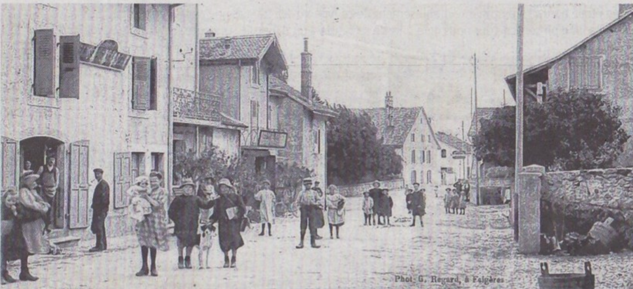
Des enfants de la commune de Valleiry, comme tous leurs camarades du canton de Saint-Julien, ont participé à cette sortie scolaire sur les flots du Léman en juillet 1913.

En ce début du XX e siècle, les instituteurs du canton de Saint-Julien, comme tous leurs collègues de France, étaient surnommés les "Hussards noirs de la République". Cette formule inventée par l'écrivain Charles Péguy évoquait la fonction prestigieuse de ces enseignants sortis de l'Ecole Normale qui avaient la lourde charge d'assurer la mission fondamentale d'une instruction scolaire obligatoire, gratuite et laïque pour tous les enfants de France. Cette école avait été mise en place par Jules Ferry après la votation de la loi de séparation des églises et de l'Etat par le parlement en 1905.