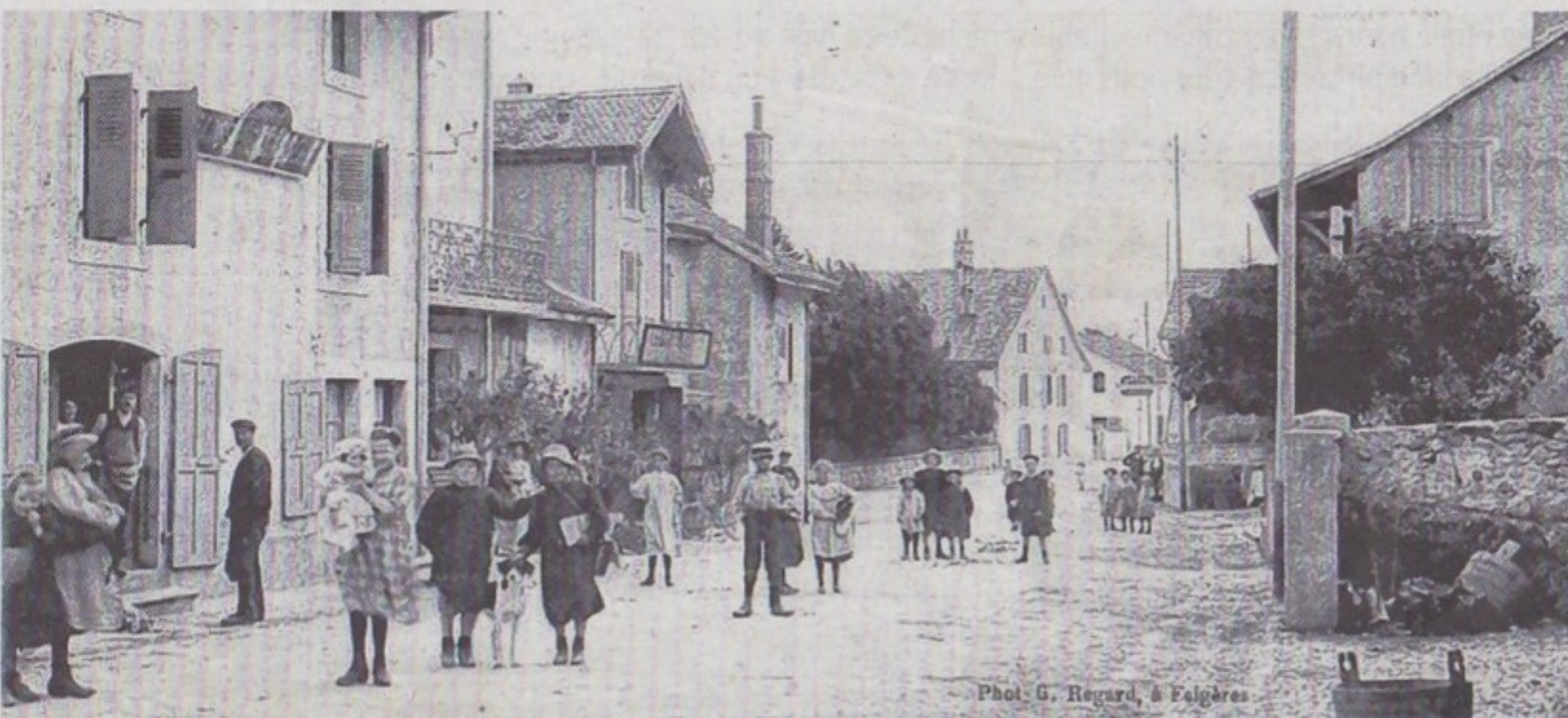
Des enfants de la commune de Valleiry, comme tous leurs camarades du canton de Saint-Julien, ont participé à cette sortie scolaire sur les flots du Léman en juillet 1913.

En ce début du XX e siècle, les instituteurs du canton de Saint-Julien, comme tous leurs collègues de France, étaient surnommés les "Hussards noirs de la République". Cette formule inventée par l'écrivain Charles Péguy évoquait la fonction prestigieuse de ces enseignants sortis de l'Ecole Normale qui avaient la lourde charge d'assurer la mission fondamentale d'une instruction scolaire obligatoire, gratuite et laïque pour tous les enfants de France. Cette école avait été mise en place par Jules Ferry après la votation de la loi de séparation des églises et de l'Etat par le parlement en 1905.