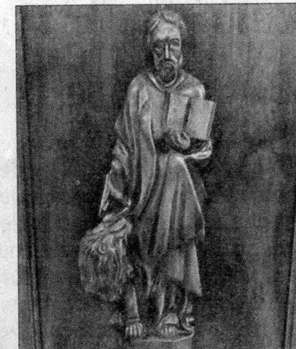
Saint Marc évangéliste, une stalle de l'église de Cruseilles.

L'agriculture se pratique dans le cadre de grands domaines dirigés par des aristocrates, qui font construire des forteresses. La colonisation du Salève s'intensifie. On y pratique l'élevage et des activités sidérurgiques.