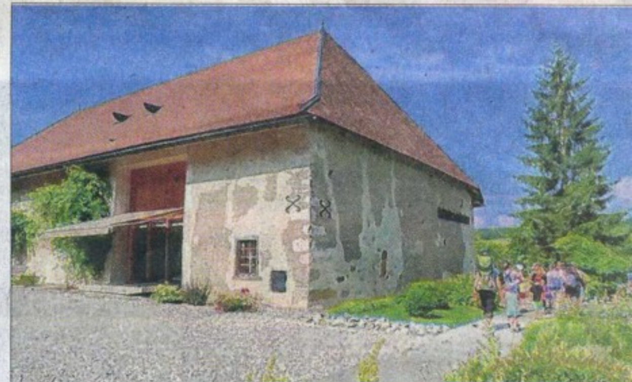
La volonté de créer un espace d'exposition à la Maison du Salève, un lieu fréquenté par le public.

Les espaces protégés en Haute-Savoie représentent 21 % du territoire, un des premiers territoires en France en termes de réserves naturelles. Afin de réagir aux mutations du territoire et de préparer l'avenir, le Département développe différents moyens d'intervention pour préserver l'environnement et les grands équilibres écologiques par une gestion rigoureuse des espaces mais aussi l'implication des territoires et des collectivités. Le contrat de territoire ENS est un outil de gestion pour les collectivités locales.