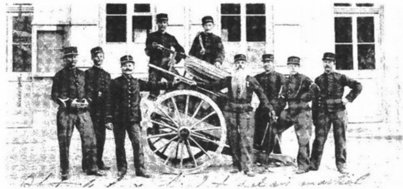
Des pompiers genevois équipés de pompes à bras de ce type, venus de Chêne-Bougerie et de Veyrier, montèrent au Salève pour combattre le feu.

Les Genevois financèrent la construction de l'hôtel de la Reconnaissance, qui abrita des familles de sinistrés.