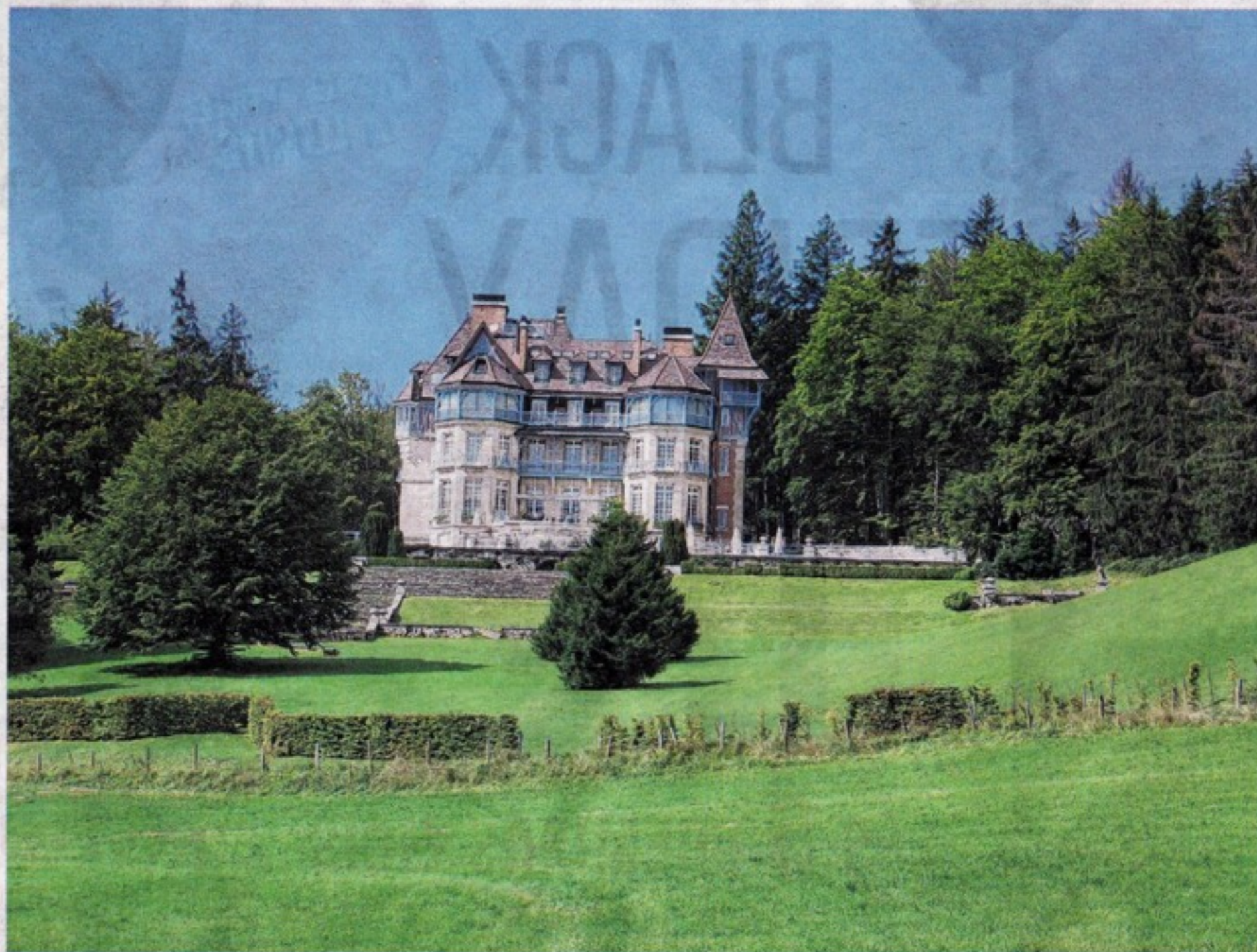
L'énorme projet urbanistique ayant échoué, le château des Avenières trône toujours avec bonheur au cœur d'une nature préservée.

Pour Pascal Hausermann, ce projet en lien direct avec Genève permettrait de créer un endroit unique, idéal pour accueillir les élites de la Genève