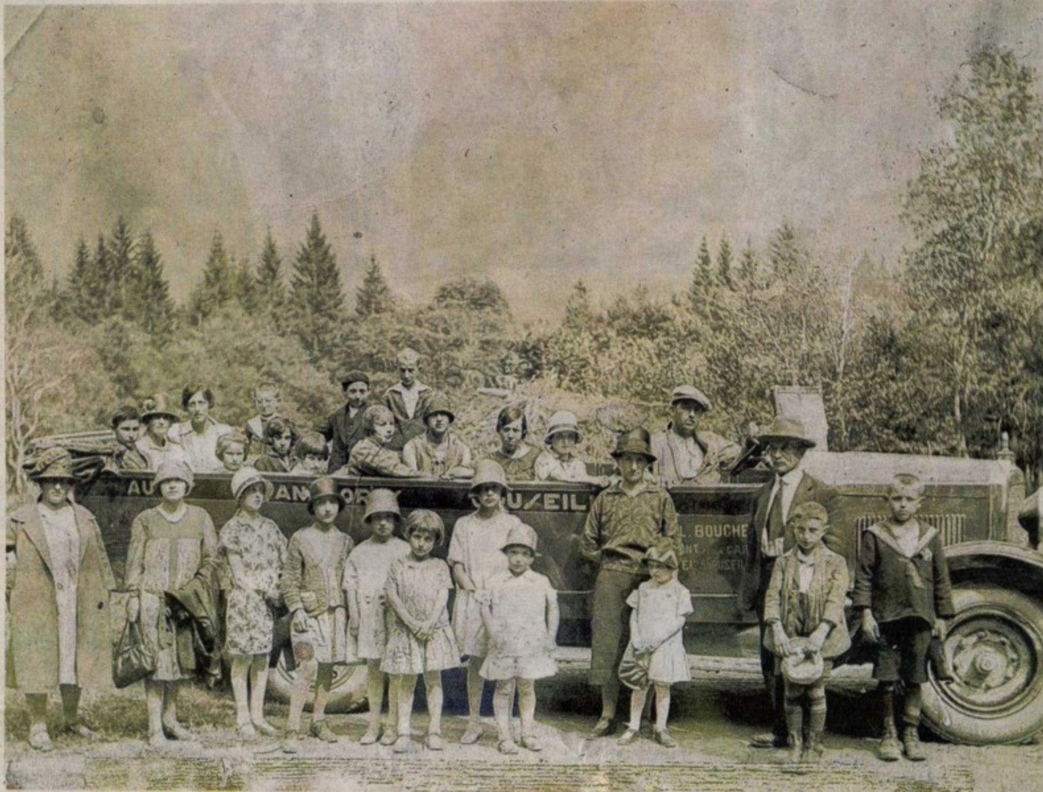
Dans les années 1930, un groupe en habits du dimanche, pour une excursion avec un autocar décapotable du garage Bouchet.

Cette firme cesse son activité en 1918, et la liaison est alors reprise par la « Société des Alpes Françaises » d'Annecy. Mais Cruseilles va rester un bourg important pour les autocars, avec la création au début des années 1920 de deux entreprises dans la petite ville. En 1921, Francis Fournier s'installe à Cruseilles et ouvre un garage et une société de transport dans la grande rue. À l'autre bout du bourg, non loin du pont de la Caille (le vénérable pont Charles-Albert construit en 1839, le second, aujourd'hui utilisé par les voitures, sera inauguré en