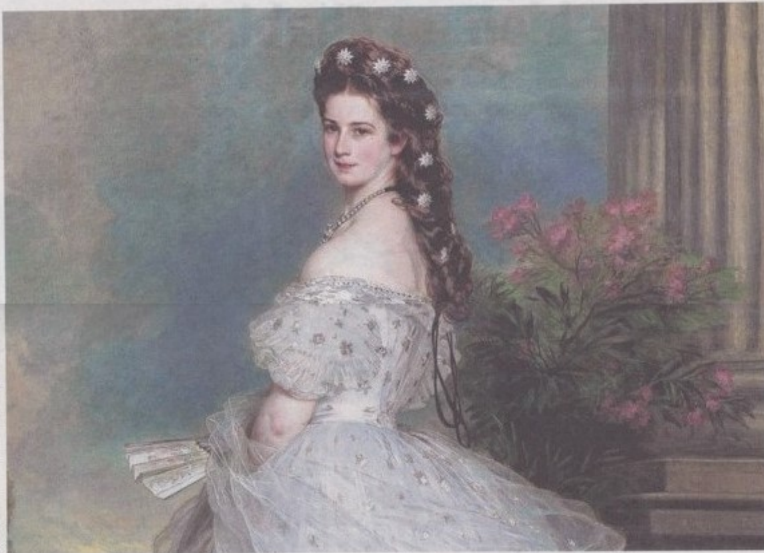
Elisabeth d'Autriche, souveraine romantique et tragique qui fut assassinée à Genève par un anarchiste le 10 septembre 1898.

Ayant quelques difficultés à s'adapter au protocole strict de la cour, cette superbe jeune femme qui fut aussi une cavalière remarquable, passa une grande partie de sa vie à voyager. Anorexique et de santé fragile, elle fut aussi marquée dans sa chair par les nombreux drames qui surviendront dans son existence, et notamment par la mort mystérieuse de son fils Rodolphe, en 1889 à Mayerling. Parmi ses lieux de villégiatures favoris, la riviéra lémanique, de Montreux à Genève, où elle séjourne dans des pa-